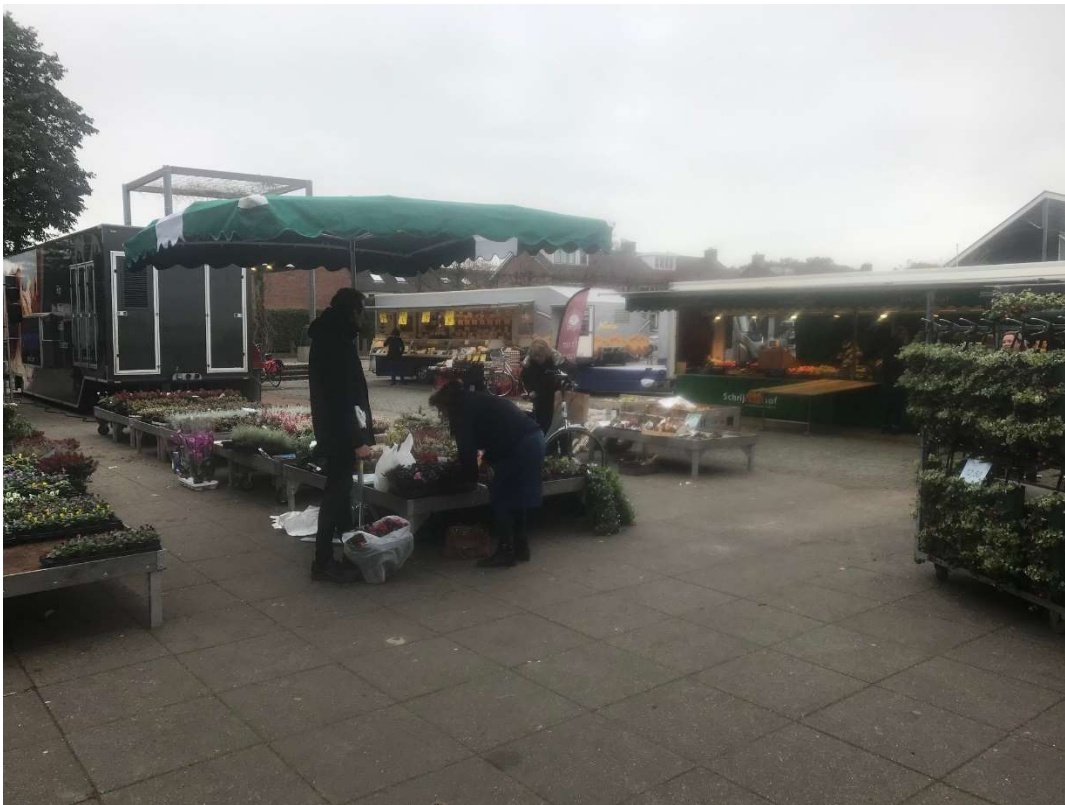
Standplaats Lindeplein Loosdrecht