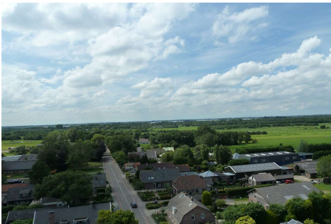
Uitzicht vanaf de kerktoren aan de Nieuw-Loosdrechtsedijk 180