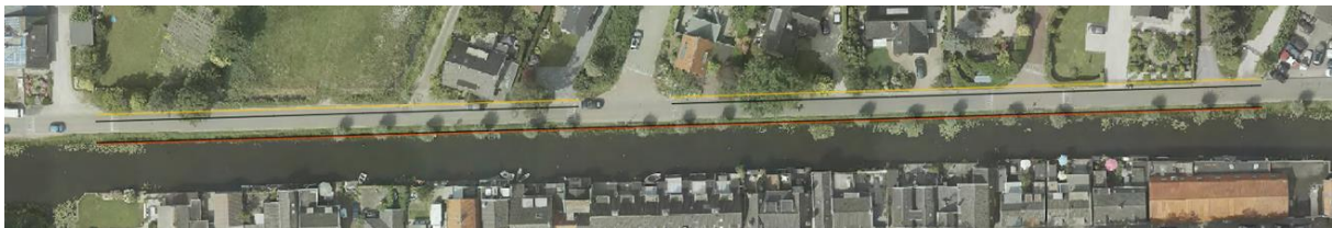
Figuur 2 Voetpad Emmaweg