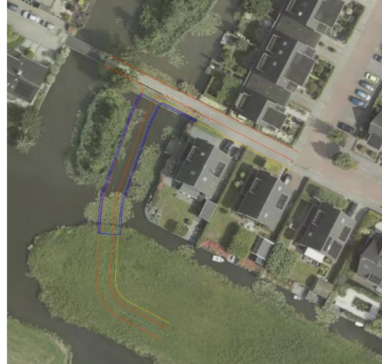
Figuur 3 Fiets- en voetverbinding