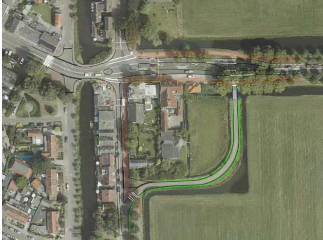
Figuur 1 Rondom de Smidsbrug