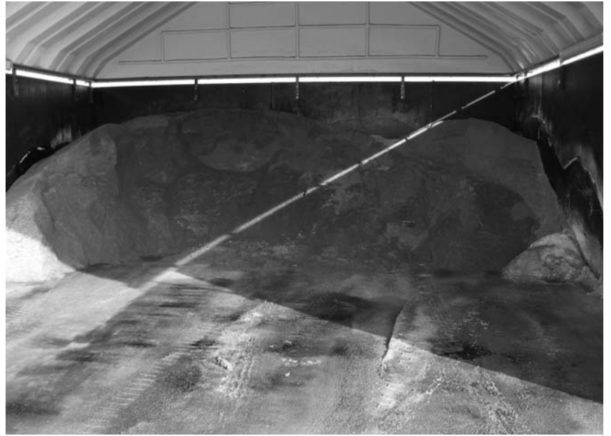
In het zoutdepot bij de gemeentewerf in Kortenhoef lag voor het weekend nog ongeveer 15.000 kilo zout. Dat is genoeg voor vier of vijf strooiwagens.

Helaas kunnen we niet overal tegelijkertijd zijn om iedereen van de winterse ongemakken te verlossen. Trottoirs strooi-