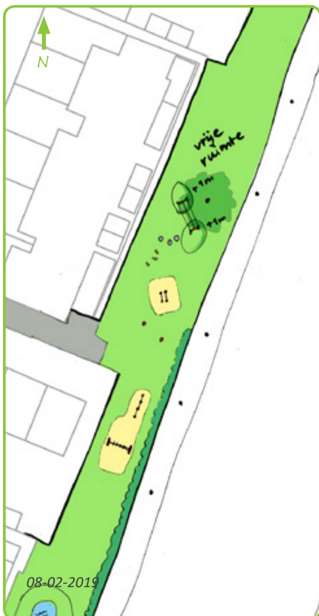
Speelplek Regenboog nu