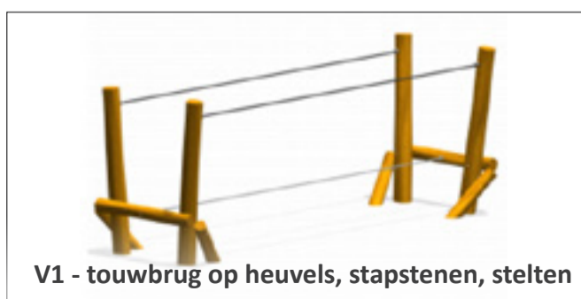
V1 - touwbrug op heuvels, stapstenen, stelten