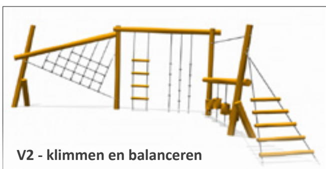
V2 - klimmen en balanceren