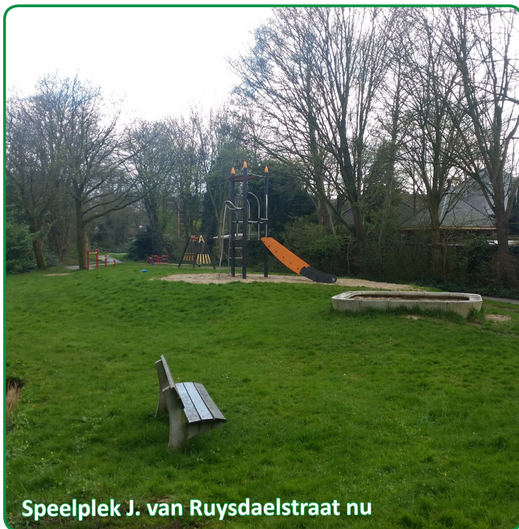
Speelplek J. van Ruysdaelstraat nu

In 2019 gaat de speelplek aan de J. van Ruysdaelstraat veranderen. Het ontwerp is gemaakt naar aanleiding van het participatietraject in september 2018.