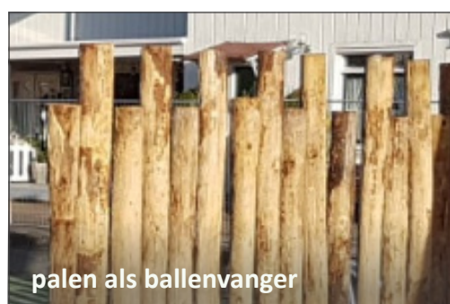
palen als ballenvanger