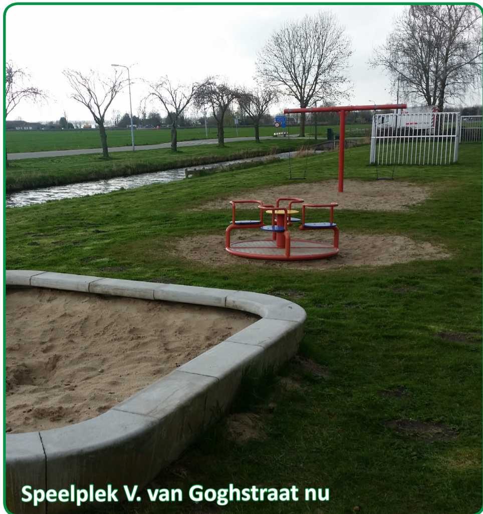
Speelplek V. van Goghstraat nu

In 2019 gaat de speelplek aan de V. van Goghstraat veranderen. Het ontwerp is gemaakt naar aanleiding van het participatietraject in september 2018.