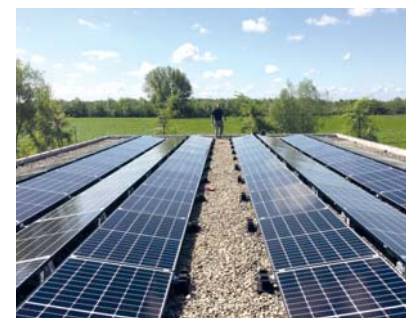
Meer info: www.energiecooperatiewijdmeren.nl

In september is er iedere dinsdagochtend van 10.00 tot 12.00 uur een inlooppreekuur voor geïnteresseerden (Koninginneweg 98, 1241CX Kortenhoef). Op maandag 17 september is er weer een informatieavond.