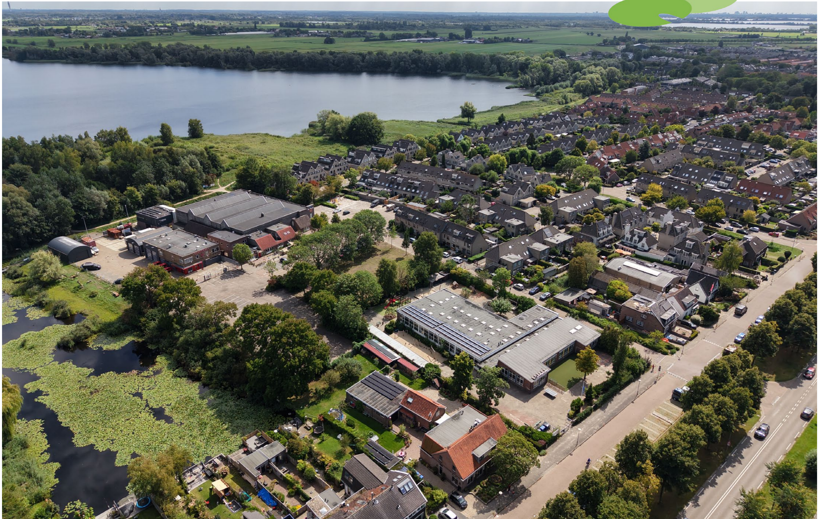
Droneopname vanuit de oostzijde