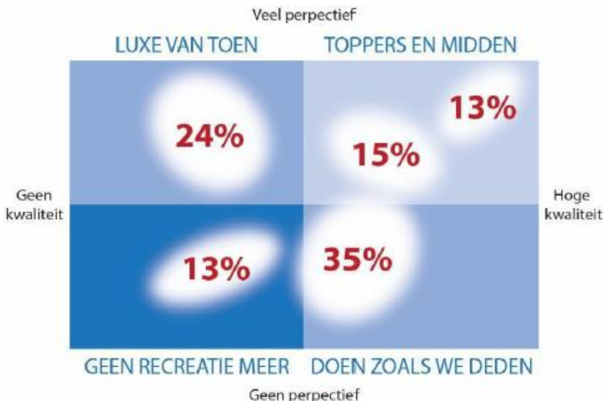
Afbeelding 1: Analyse recreatie-aanbod (Bron: Gebiedsvisie Recreatie en Toerisme Loosdrechts Plassengebied door ZKA en Vrolijk's 2016).

In hoofdstuk 1 is al benoemd dat de gemeente Wijdmeren een groots toeristisch-recreatief verleden heeft. Vaak wordt er nog gerept over de dagen waarop mensen van heinde en verre kwamen om te recreëren op de plas of in de natuur. Na de Tweede Wereldoorlog nam de recreatie in dit gebied een enorme vlucht. Met name Duitsers kwamen in groten getale naar het gebied. In de jaren '60 en '70 kende het gebied een grote groei aan toeristen, waarbij het voorzieningenniveau steeg. Met de ontwikkeling van andere recreatiegebieden nam het aantal toeristen in het gebied echter af. In 1986 wordt in de ruimtelijk-economische structuurschets van de gemeente Loosdrecht al geconstateerd dat het gebied haar marktaandeel in rap tempo aan het verliezen is. De enorme aantrekkingskracht van het gebied in de jaren '60 en '70 was ongekend en is sinds die tijd niet meer geëvenaard. Het voorzieningenniveau en de inrichting van de parken is op bepaalde aspecten blijven hangen op het niveau van de hoogtijdagen. Ondernemers herkennen deze uitdaging ook. In het onderzoek van ZKA en Vrolijk's wordt geconstateerd dat het recreatie-aanbod deels verouderd en versleten is.